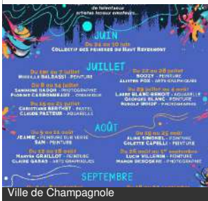
Ville de Champagnole