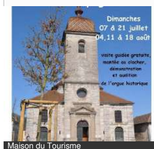
Maison du Tourisme

Dimanches 07 & 21 juillet 04, 11 & 18 août